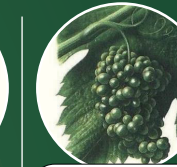
Fermeture de la grappe