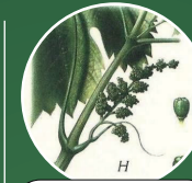
Boutons floraux séparés