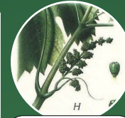
Boutons floraux séprés