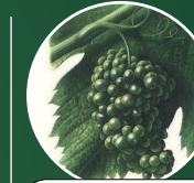
Fermeture de la grappe